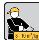
Výdatnosť 8 - 10 m 2 /kg