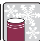
Chrání pred mrazom